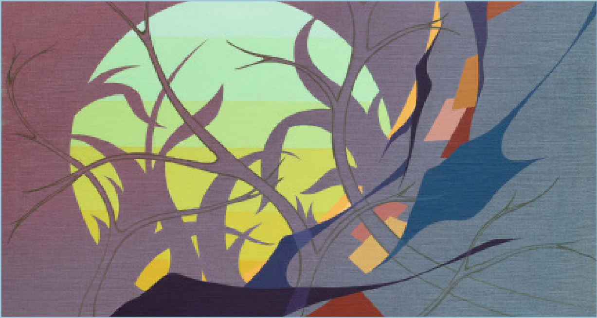
Udsnit af Ghosts . 2018