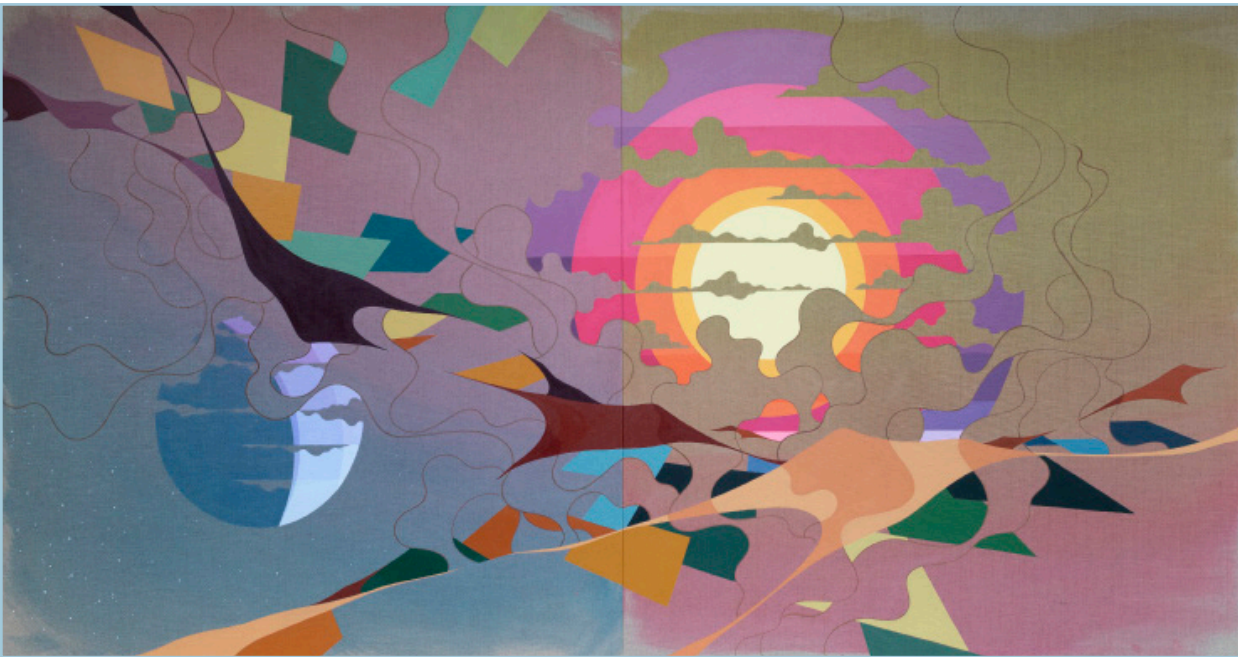
Udsnit af Fundamental Uncertainty (Night/Day) , 2018