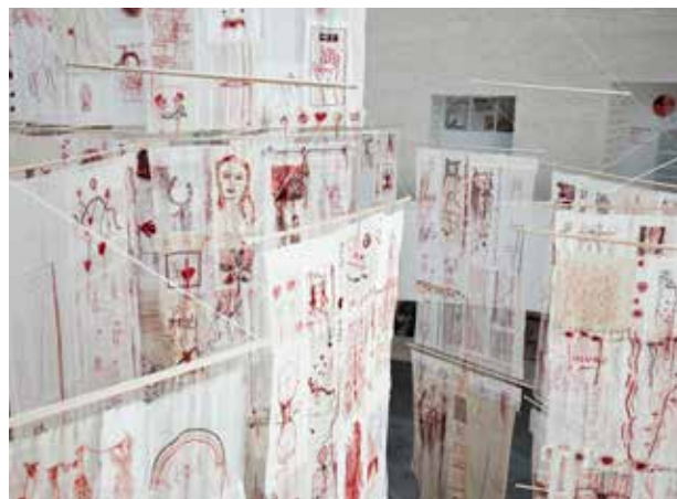
Der var fernisering på det færdige værk på Trapholt d. 27.6.2020.