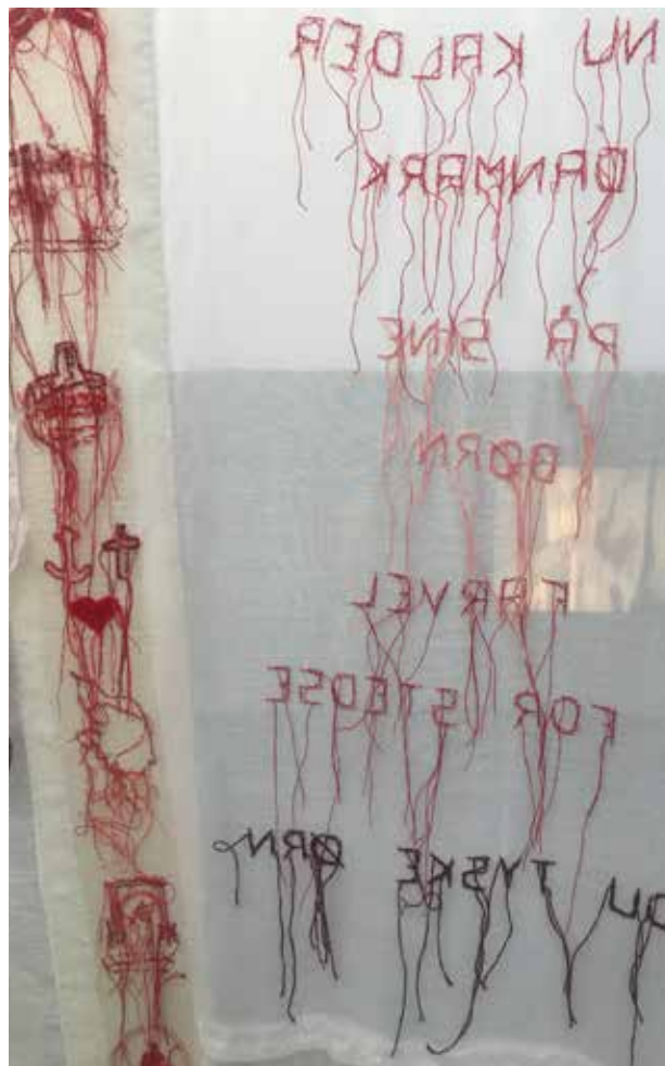
Et vigtigt element i værket var de løsthængende tråde.