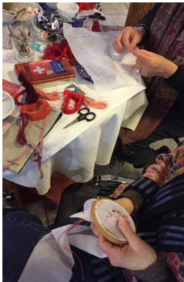
Til broderiaftnerne på Trapholt og workshopsne rundt omkring i landet gik snakken lystigt om broderiet. En deltager bemærkede blandt andet hvordan "der ingen barriere er omkring broderi: Det er ligesom, når det sner, så har folk noget fælles at snakke om".