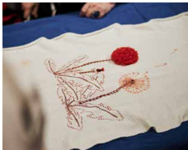
Deltagerne viser deres broderier frem og udveksler erfaringer omkring processen til et af broderiarrangementerne på Trapholt.

I forlængelse af Gauntletts optimistiske tænkning er det imidlertid relevant med to nuancerende og mere kritiske perspektiver på sammenhængen mellem kreativitet og forandring. For det første kan det indvendes, at små skridt mod kreativ gøren ikke sådan uden videre fører 'empowerment' og forandring med sig. Individet vil nemlig altid være indvævet i magthierarkier og implicite censureringsmekanismer (jf. Butler 1997), der nødvendigvis må synliggøres og påpeges, før de kan forhandles og forandres.